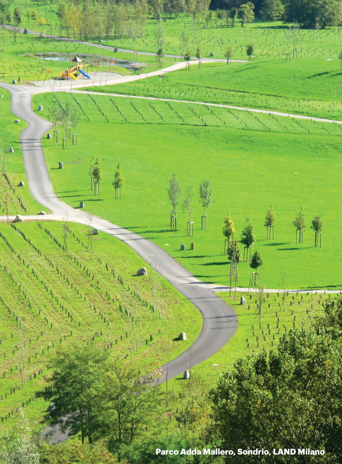
Parco Adda Mailero, Sondrio, LAND Milano